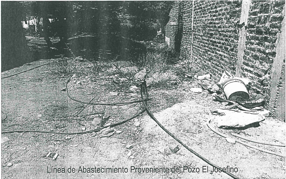
Línea de Abastecimiento Proveniente del Pozo El Josefino